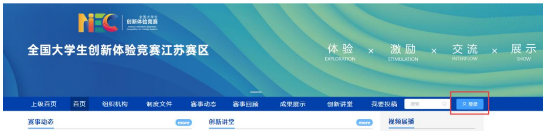
图 4 官网登录

先注册，后登录；若已有账号，直接点击账户登录。图 5 显示用户注册入口，图 6 显示用户登录入口