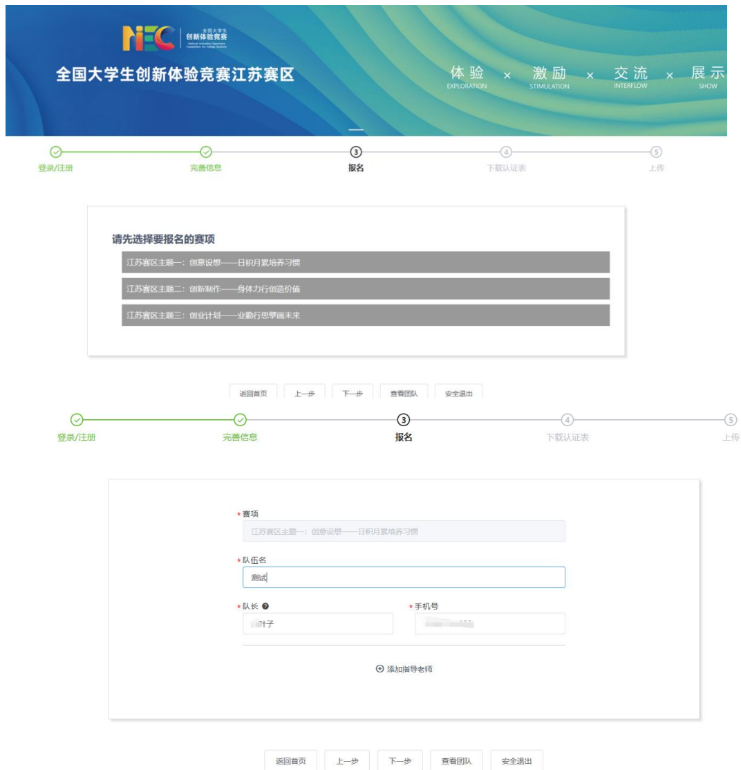
图 9 报名信息页面