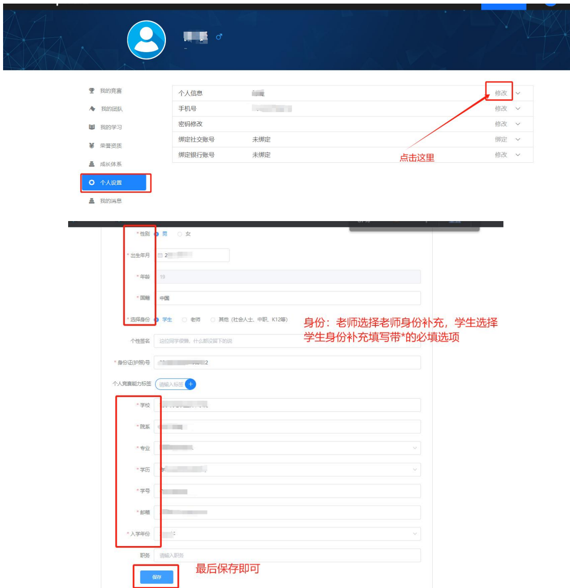
图 13: 个人信息页面