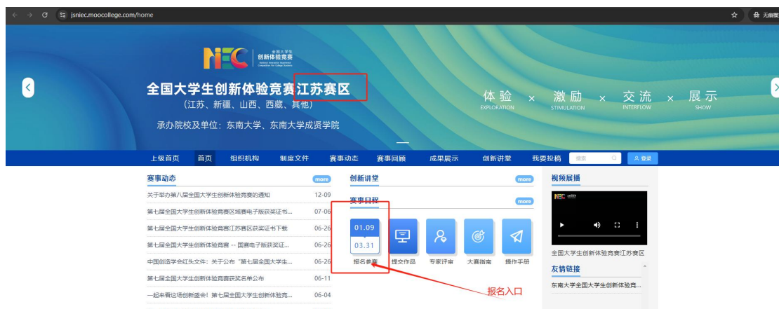
图 7 报名参赛

2. 队长完善个人信息：登录之后，队长先完善个人信息，如图 8 所示，星号必填，信息填写好点击下一步