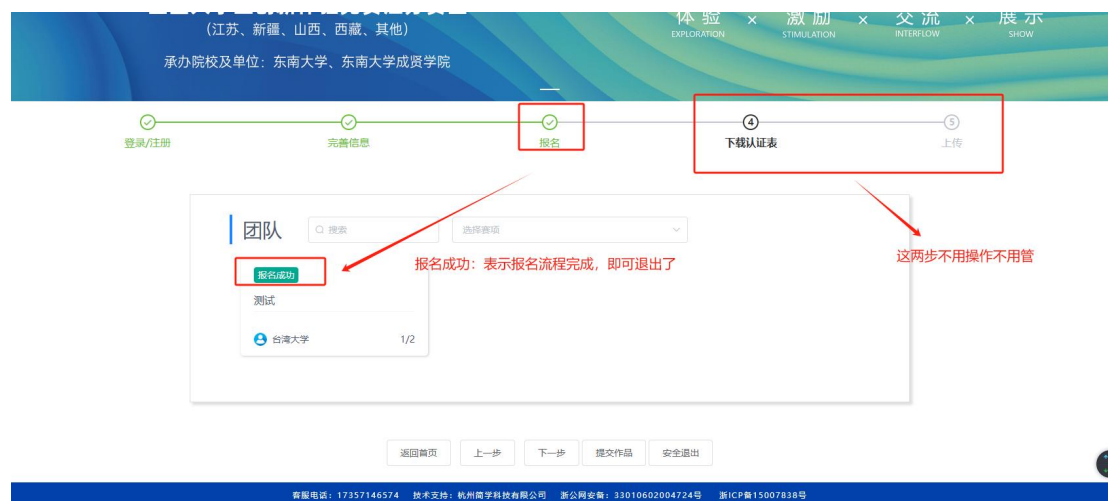
图 14 报名成功页面

注意：摩课云完成报名流程后，提交参赛作品流程在【赛事方的小程序上进行，不使用摩课云竞赛系统提交】，报名截止后，届时会把报名数据统一同步到官方小程序系统上，再进行参赛作品提交。