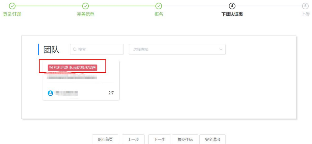
图 10 报名队伍状态