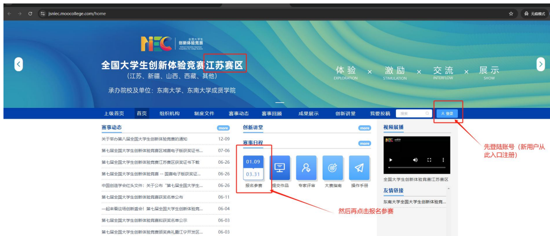
图 3 江苏赛区官网