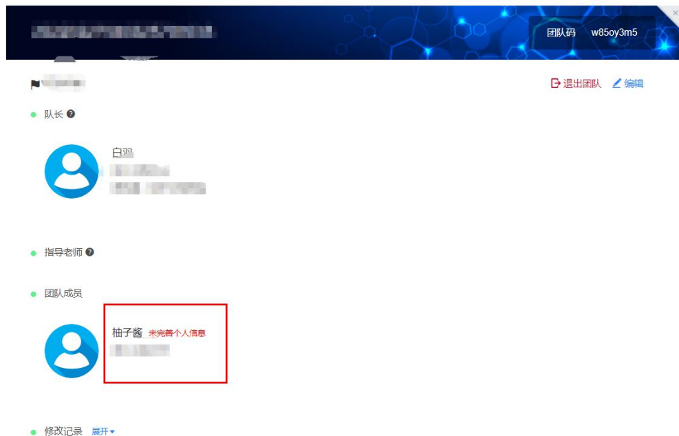
图 11 队伍编辑页面