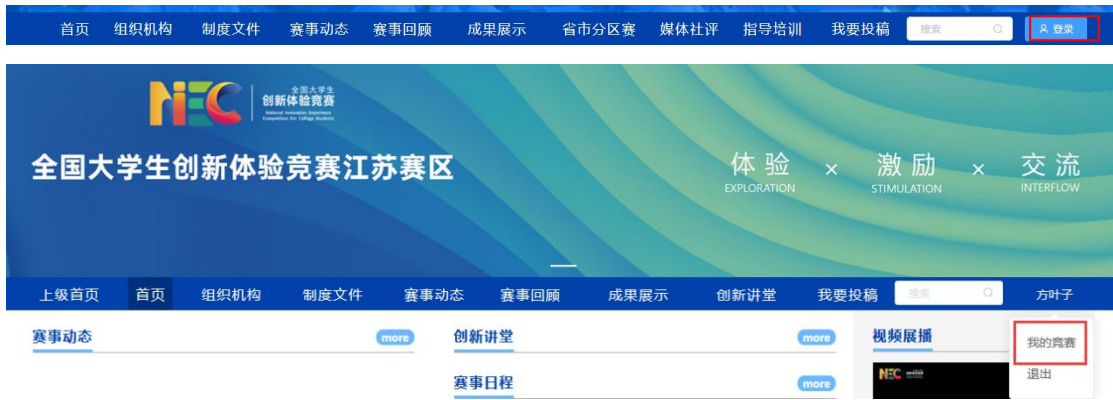
图 12 我的竞赛